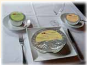
Ejemplo de una comida para persona alérgica